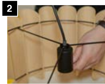
2 Pull cord until socket bottoms out.