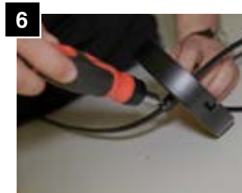
6 After adjusting cord length, tighten set screw on canopy.