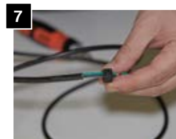
7 Feed additional strain relief through cord.