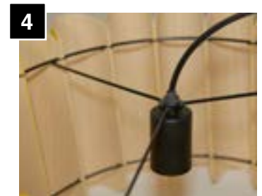
4 Firmly tighten socket to shade ring.