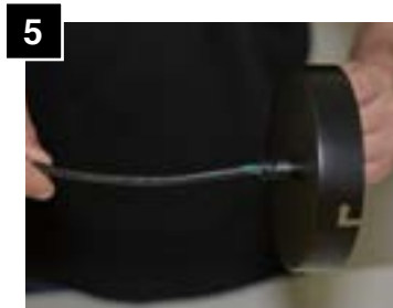
5 Feed cord through canopy.