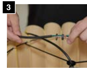
3 Pass lock washer and nut through cable.